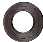
Rollo de Bobina de Enfardar compacta y uniforme.