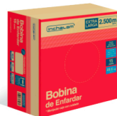
Práctica caja cartón permite fácil manipulación y traslado.

Prepicado para retirar el producto fácilmente.